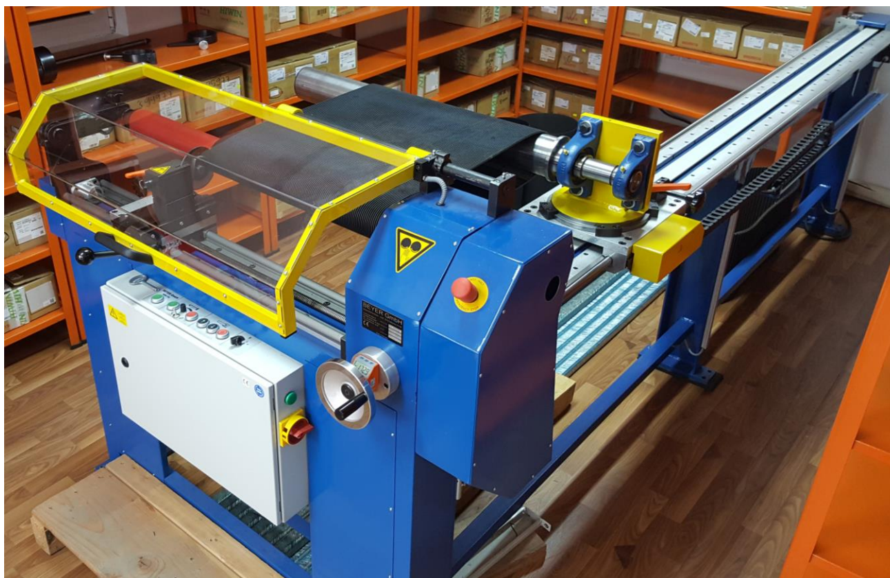
Mašina za sečenje rebrastih kaiševa iz rukavaca (na željeni broj rebara)

PJ 1930 x 10 rebra (ili po OPTIBELT sistemu označavanja 10 PJ 1930 ) (rebrasti kaiš profila PJ , dužine 1930 mm , sa 10 rebara )